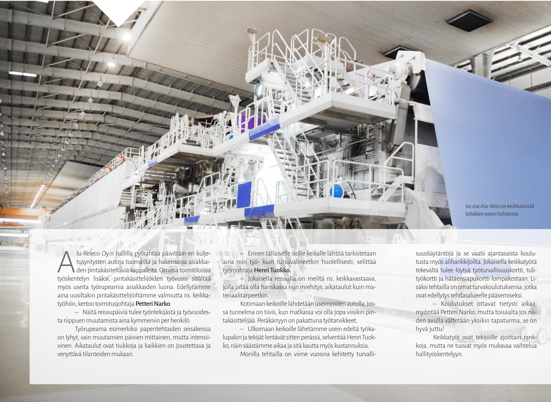
Iso osa Alu-Relecon keikkatöistä tehdään paperitehtaissa.